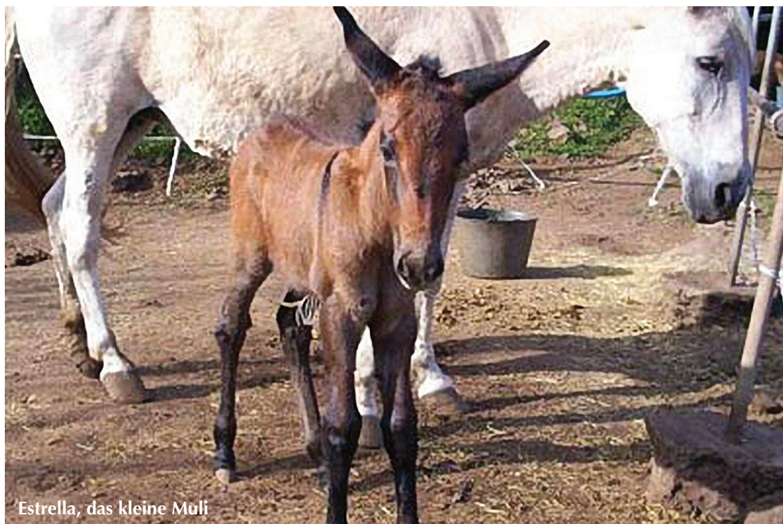
Estrella, das kleine Muli

man durch die Wälder und Vulkanlandschaften mit Übernachtung am Lagerfeuer im Wald. Die Termine dafür sind am 31.07./01.08.2007, 21.08./22.08.2007 und 04.09./05.09.2007. Wem zwei Tage noch zu wenig sind, der kann auch einen 3-Tages-Trail buchen. Da wären die Termine am 18.-20. und am 25.-27. September.